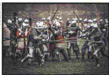
C. BALOSSINI (2)