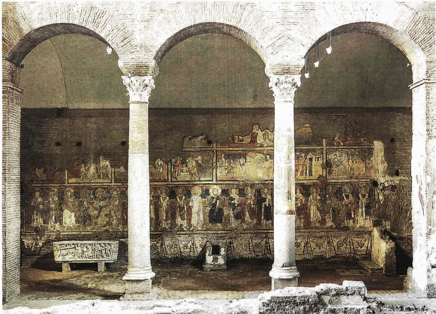
Schiera di beatitudine Navata est. Cristo tra i Padri della Chiesa orientali e occidentali e storie dell'Antico Testamento

Informazione, approfondimenti, gallery fotografiche e la mappa degli appuntamenti più importanti in Italia. È disponibile sull'App Store di Apple la nuova applicazione culturale del «Corriere della Sera Eventi». È gratis per 7 giorni.